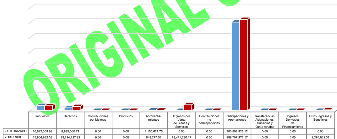
Gráfico 4. Ingresos